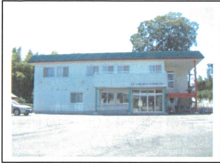
センター全景（1階部分）