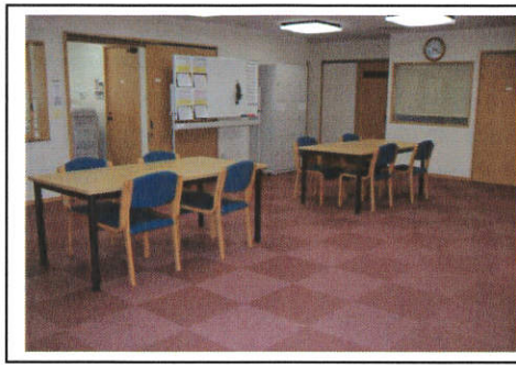
オープンスペース